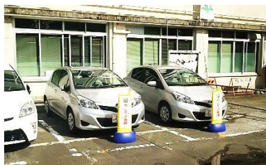
正面玄関脇のステーション